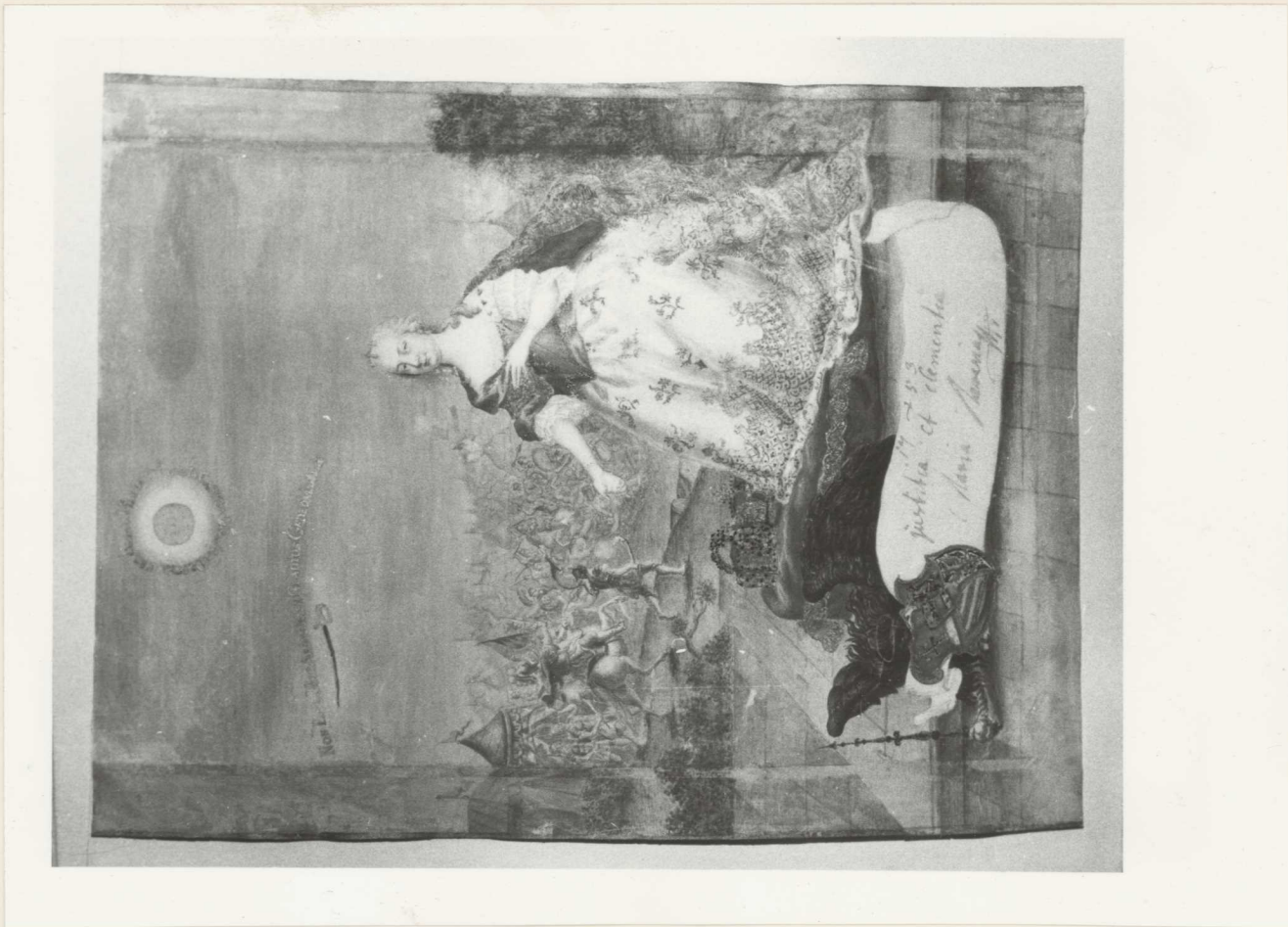
2. Tisztiho ntan