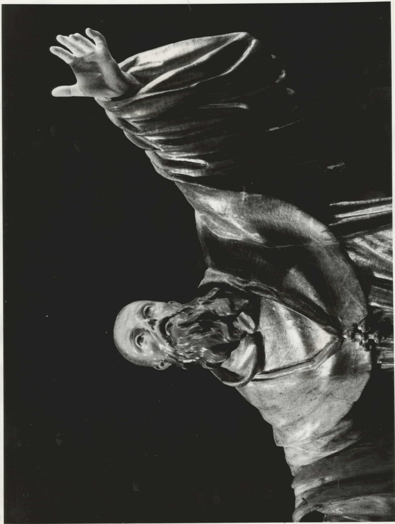
KEZBÜLSŐ ÁLLAOT: A REPEDÉSEK ÉS AZ ÚJ HIÁNYOK PÓTLÁSA