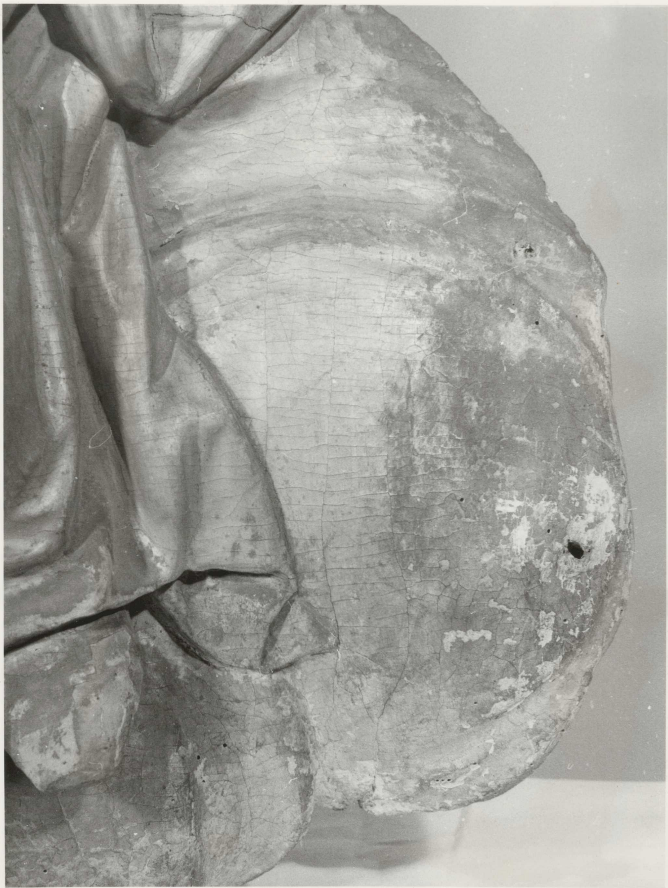
EREDETI ALLAPOT; A felhő jobb oldalán hiányos, nereg.