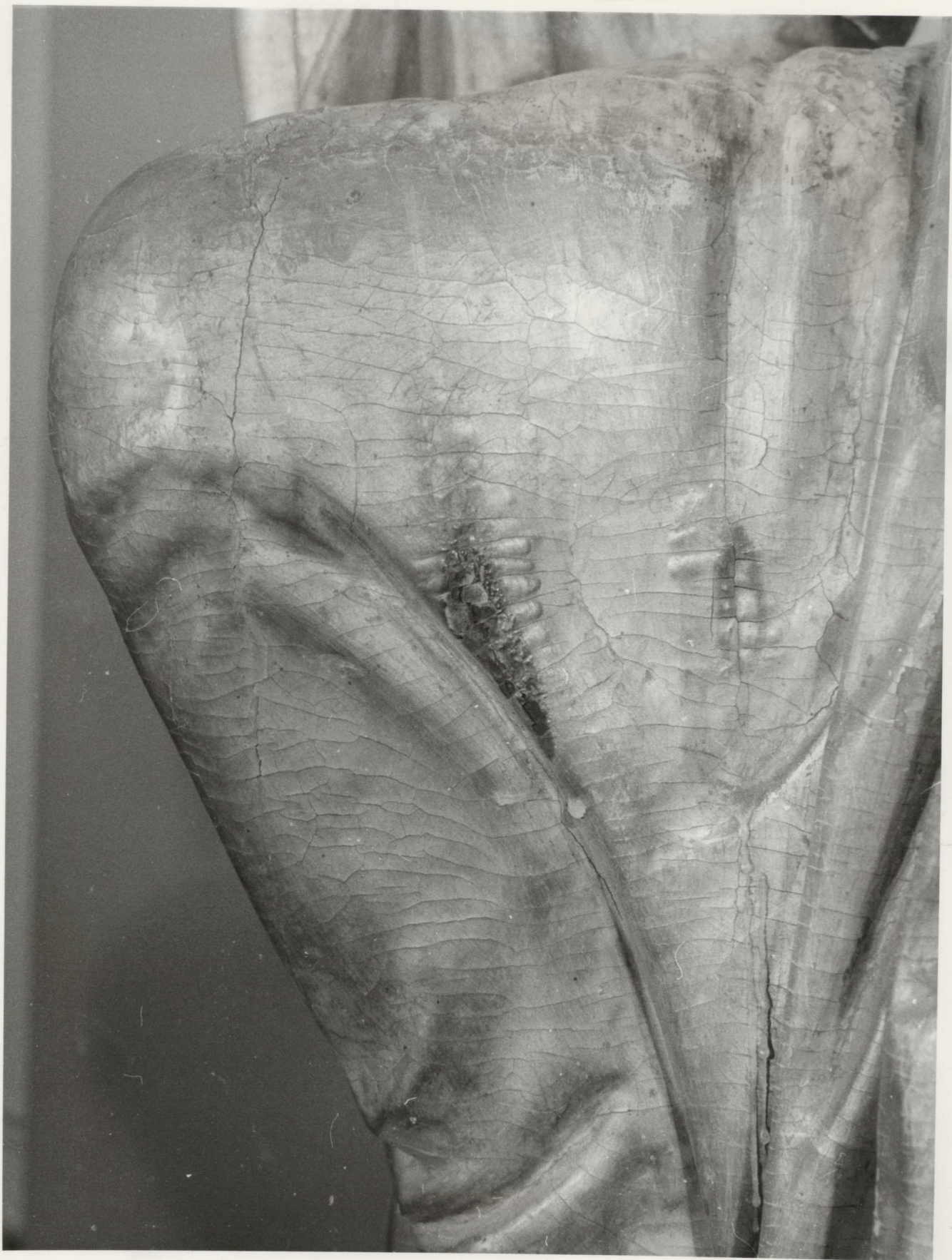
EREDETI ÁLLAPOT : Aranyozott kéreg, négy, két helyen megégett.