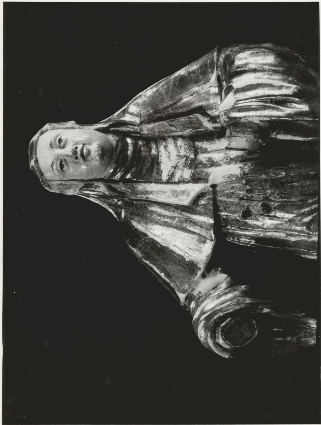
LŐZBÜLSŐ ÁLLAPOT : A DRAPÉRIA HÍÁNYAINAK PÓTLÁSA