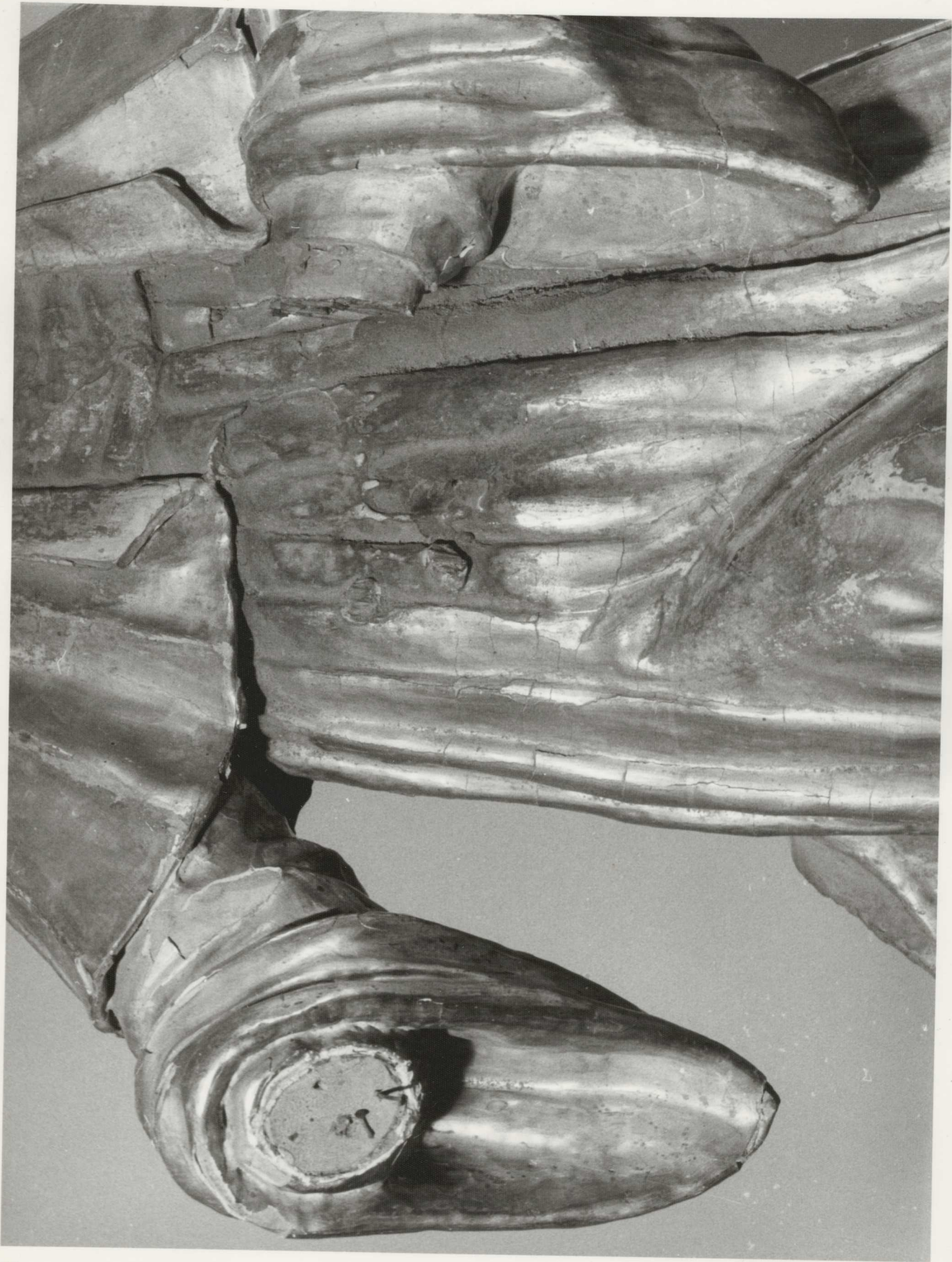
EREDETI ÁLLAPOT : az aranyszóth réteg kiányos, nereg, 2020