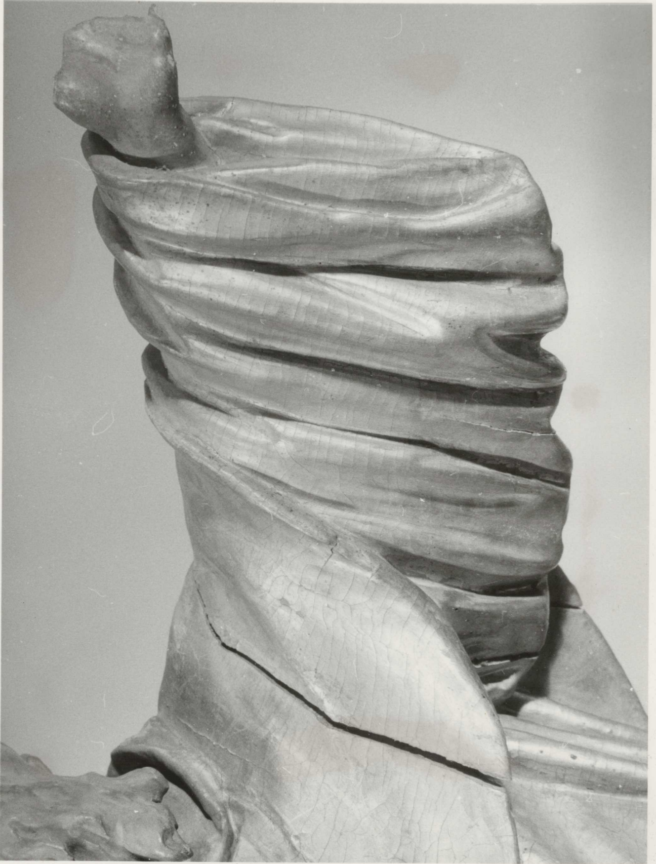
EREDETI ALLAPOT : Ruhaján 4566 helyen hasadlos Hidmors...