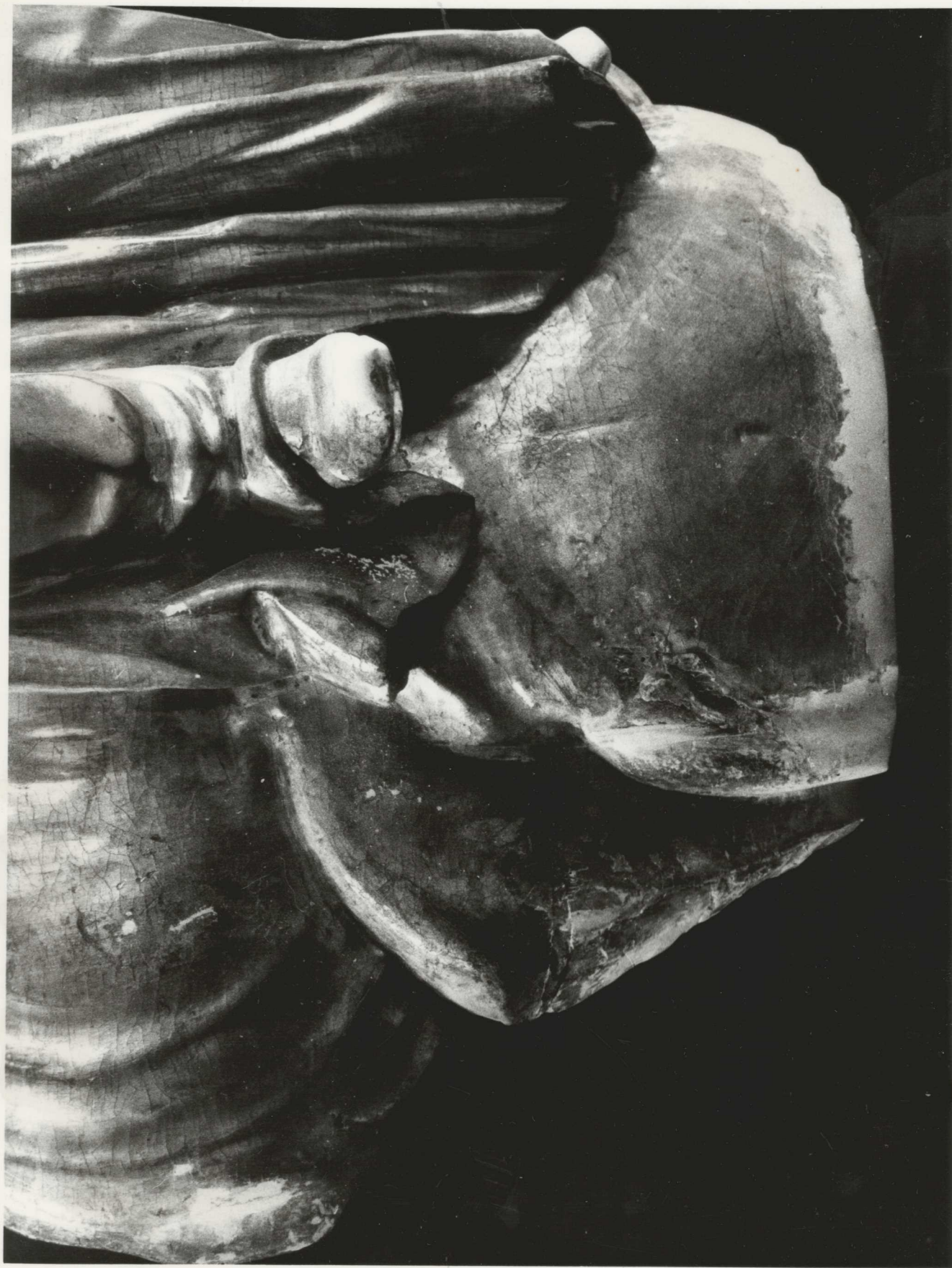
Közvetlen állapot : A PELHŐ ALJÓ RÉSZÉNEK ÉS A CIPŐ HÍMNYAINAK PÓTLÁSA