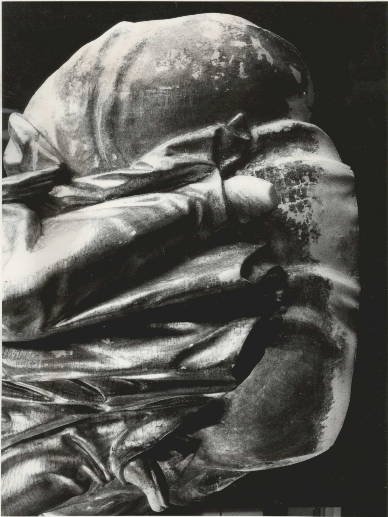
KÖZBÜLSÖ ÁLLAPOT : AUL A FELHÖ HIÁNYAINAK VALAHIINT A CIPÖK Hiányainak Kéfa alapraja ei mi mólora