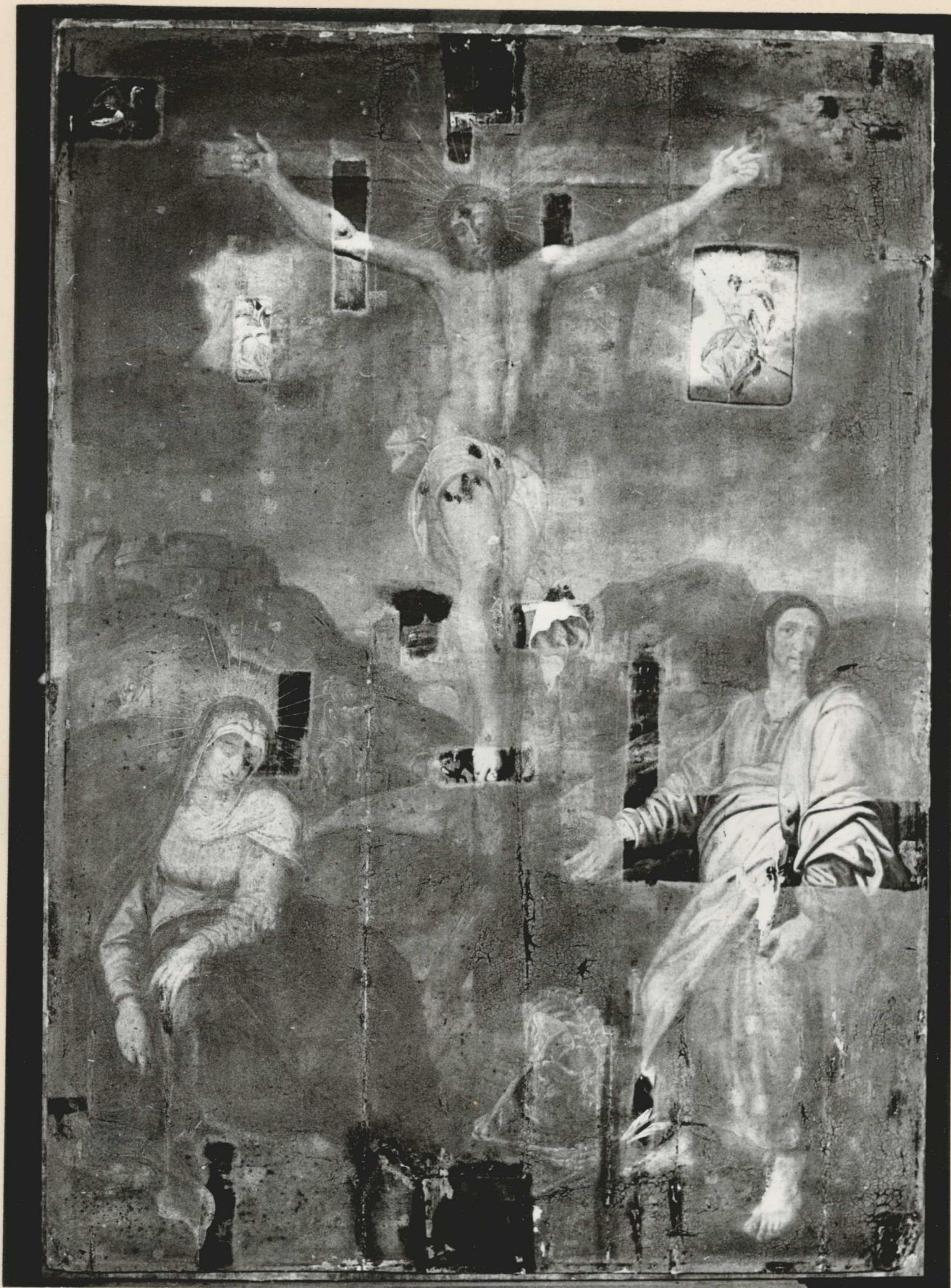
14. Tisztítópróba. Lumineszcens felvétel.