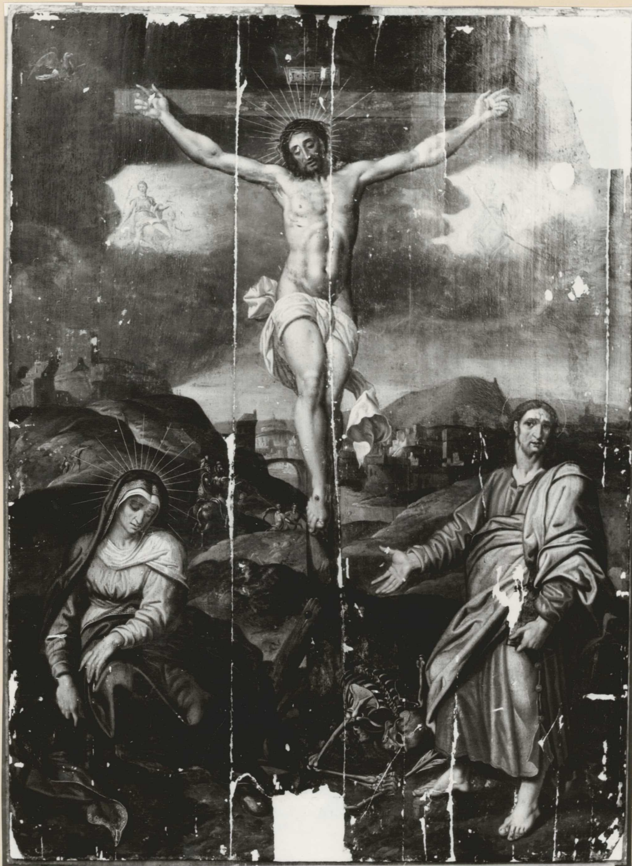
22. A tábla kitömitett állapotban.