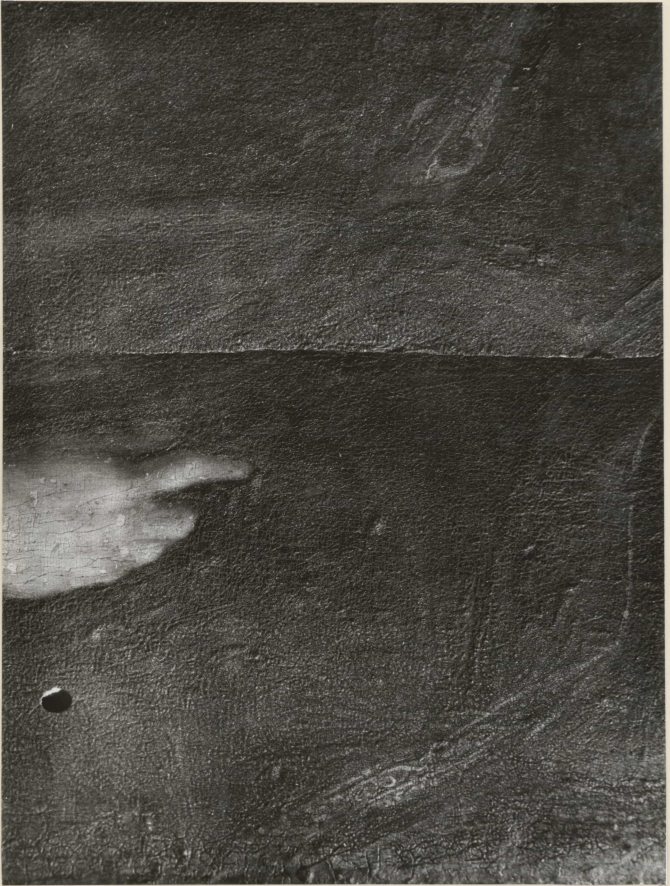
9. Részlet. A tábla a rossz parkettázás következtében megrepedt, és megvetemedett. mária jobb keze mellett 0,5 cm átmérőjű lyuk volt.