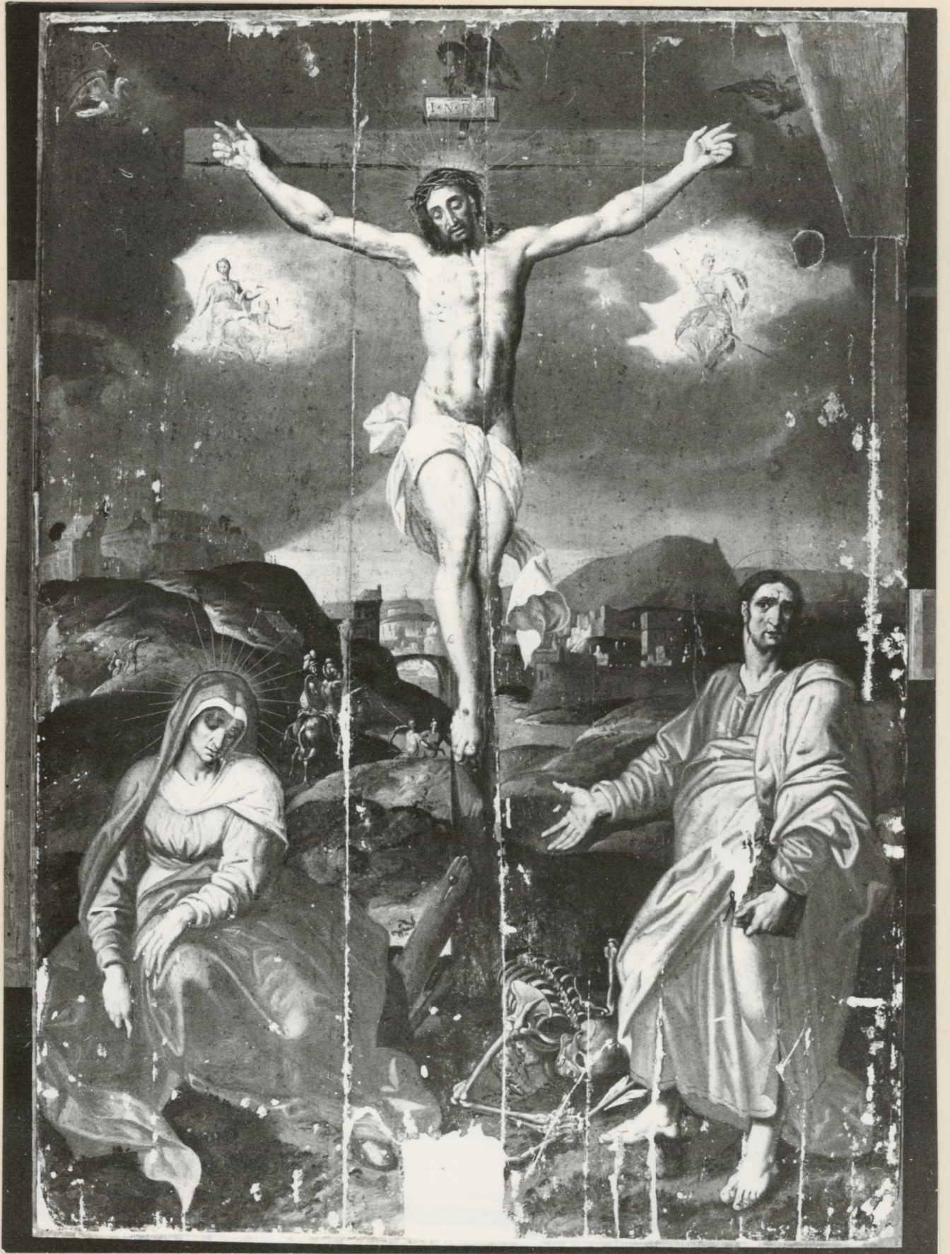
21. A tábla teljesen letisztított és félig kitömitett állapotban.