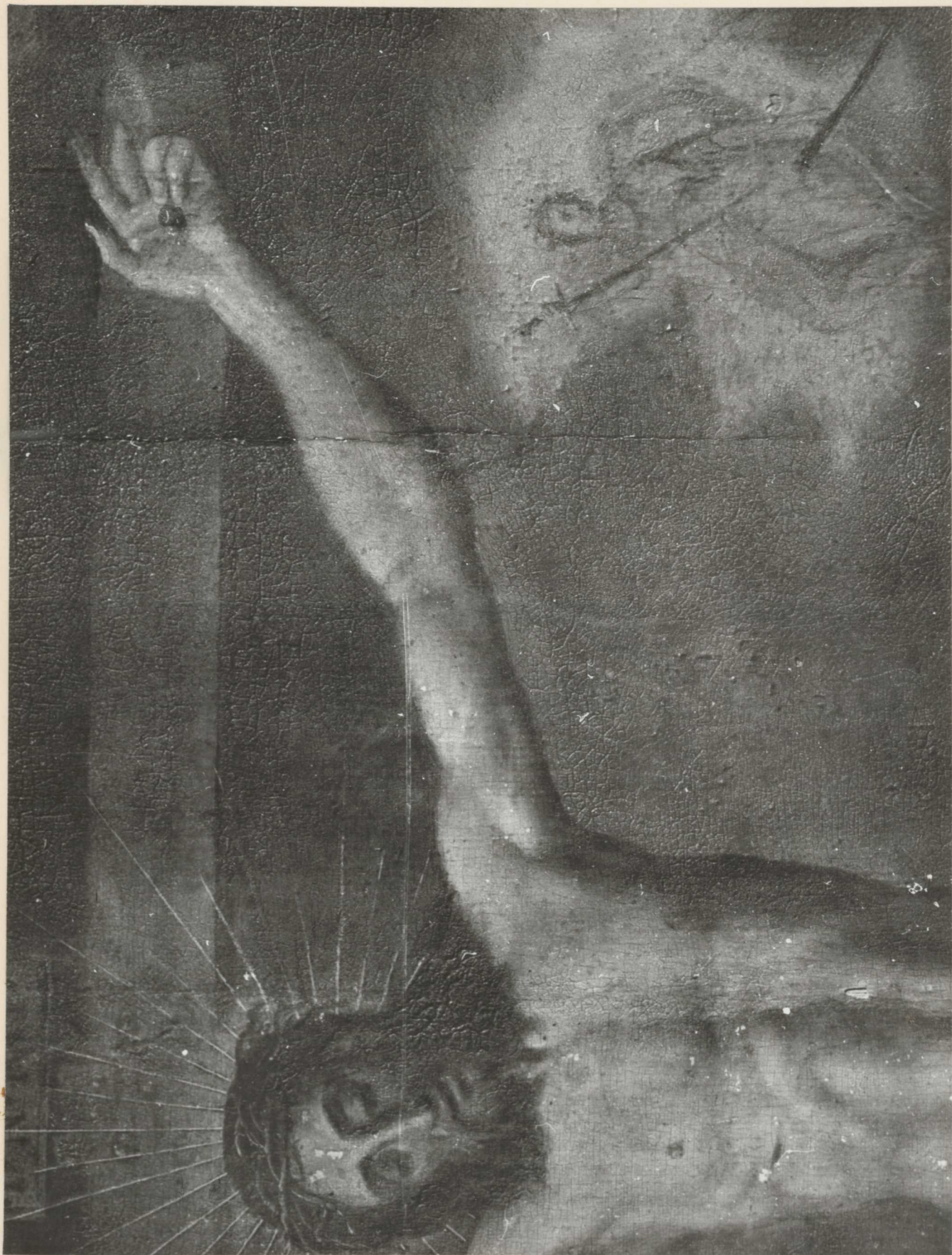
6. Készlet. A festékfelület sok helyen kisebb nagyobb mértékben felholyagzott. megfigyelhető a tábla egyik nagyobb függőleges repedése.