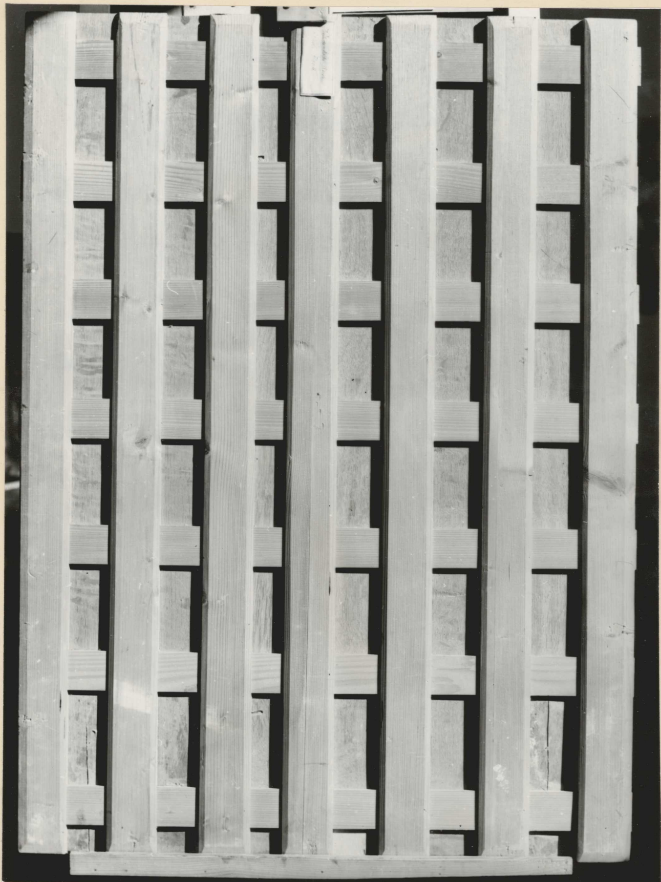
2. Restaurálás előtti állapot. A tábla hátoldalát egy korábbi restaurálás alkalmával lesorvasztották és parkettázták. A tábla ennek következtében több helyen elrepedt és megvetemedett.