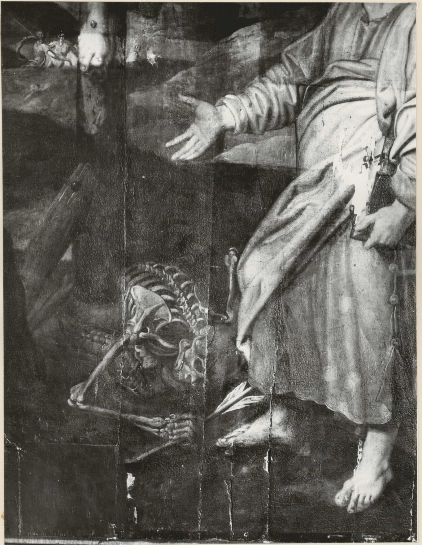
19. Részlet. Tisztítás közben.