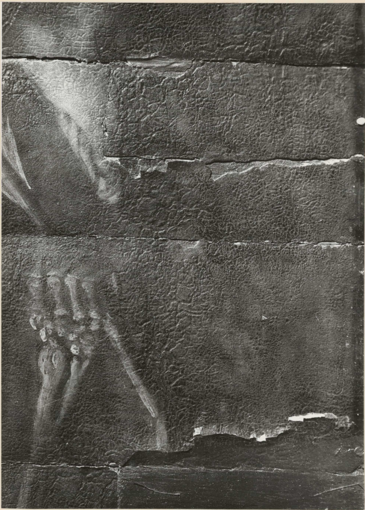
11. Részlet. A tábla alsó szélének függőleges repedései és a festékréteg felcserepedése.