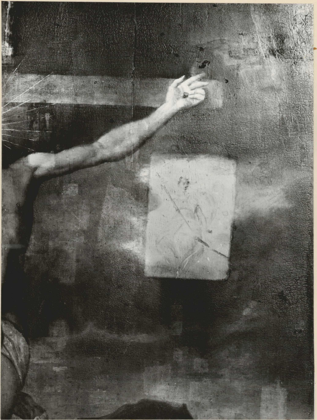
16. Tisztítópróbák. Részlet.