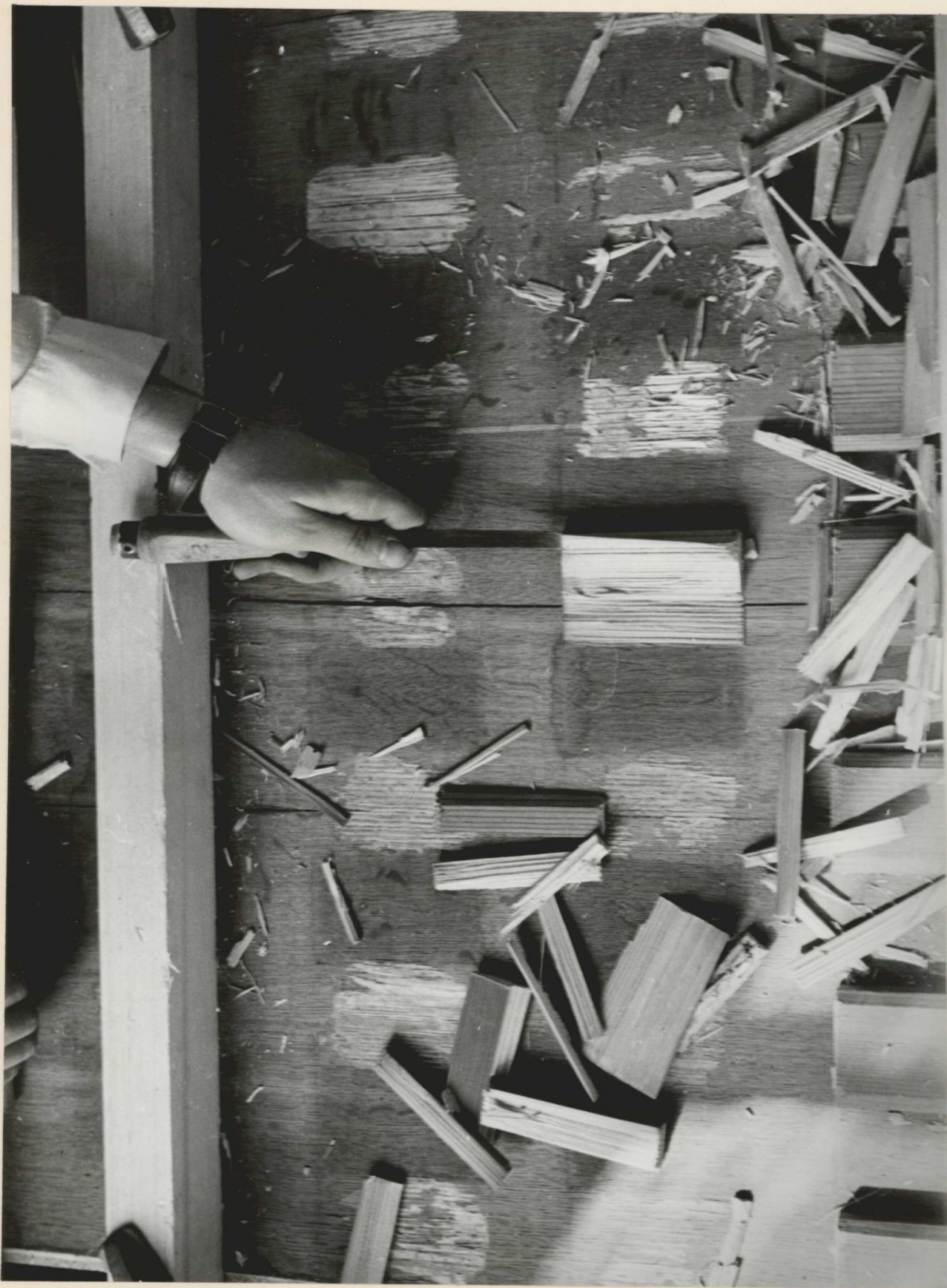
13. A régi parkettalécék levésése.