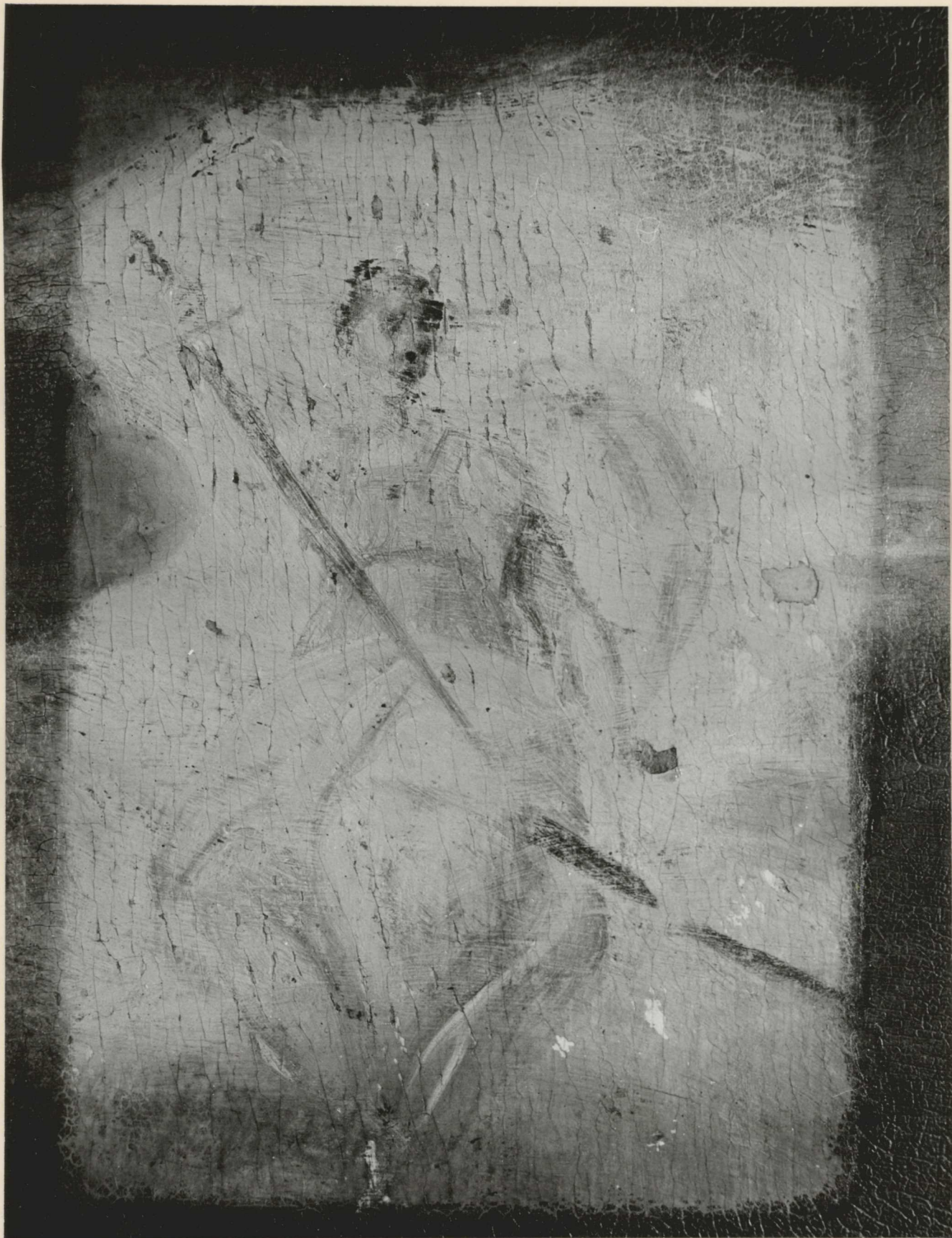
17. Részlet. A jobb oldali allegorikus figura letisztított állapotban. A festékréteg alposan lekopott.