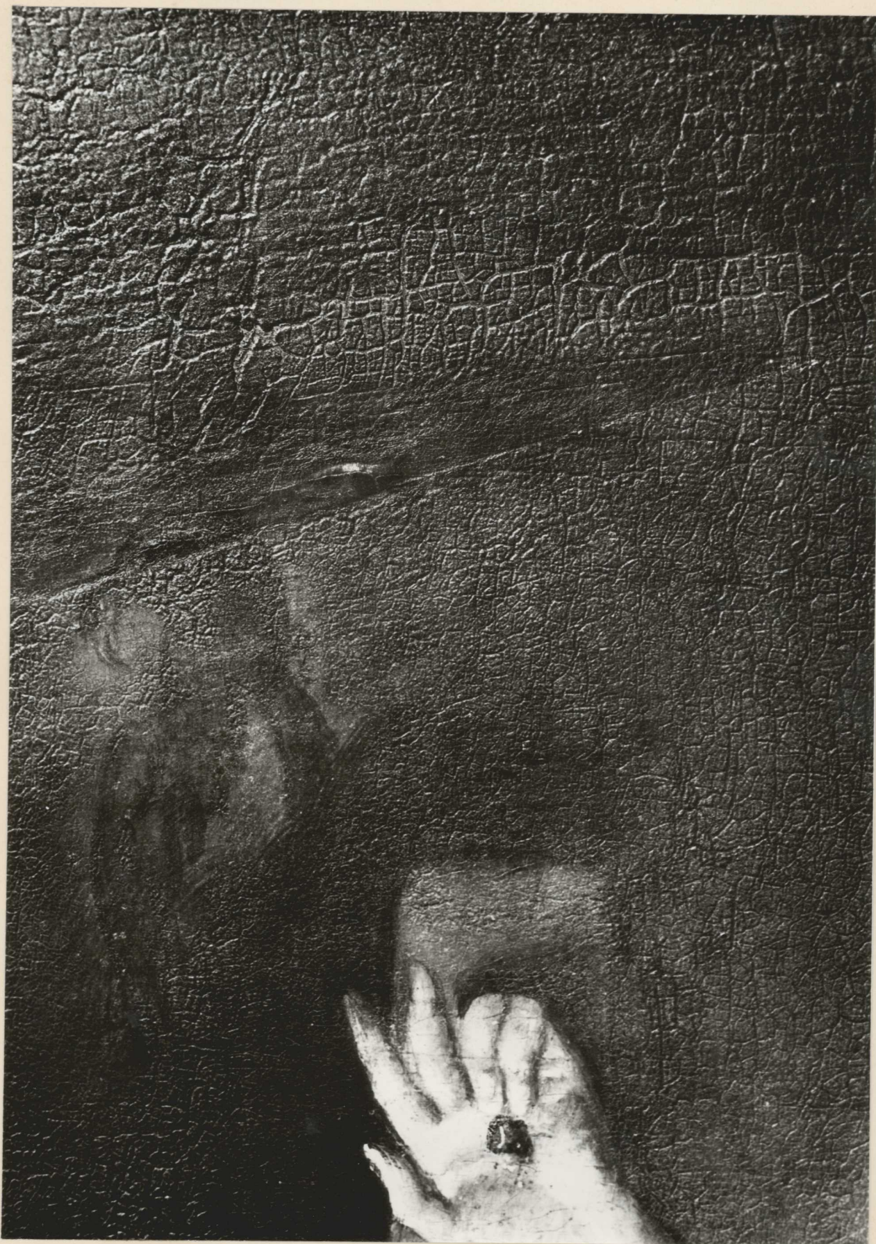
7. Részlet. Surolofényes felvétel. A hiányzó jobb felső sarok kiegészítése. Jól látható a vastag lakkréteg repedezettsége.