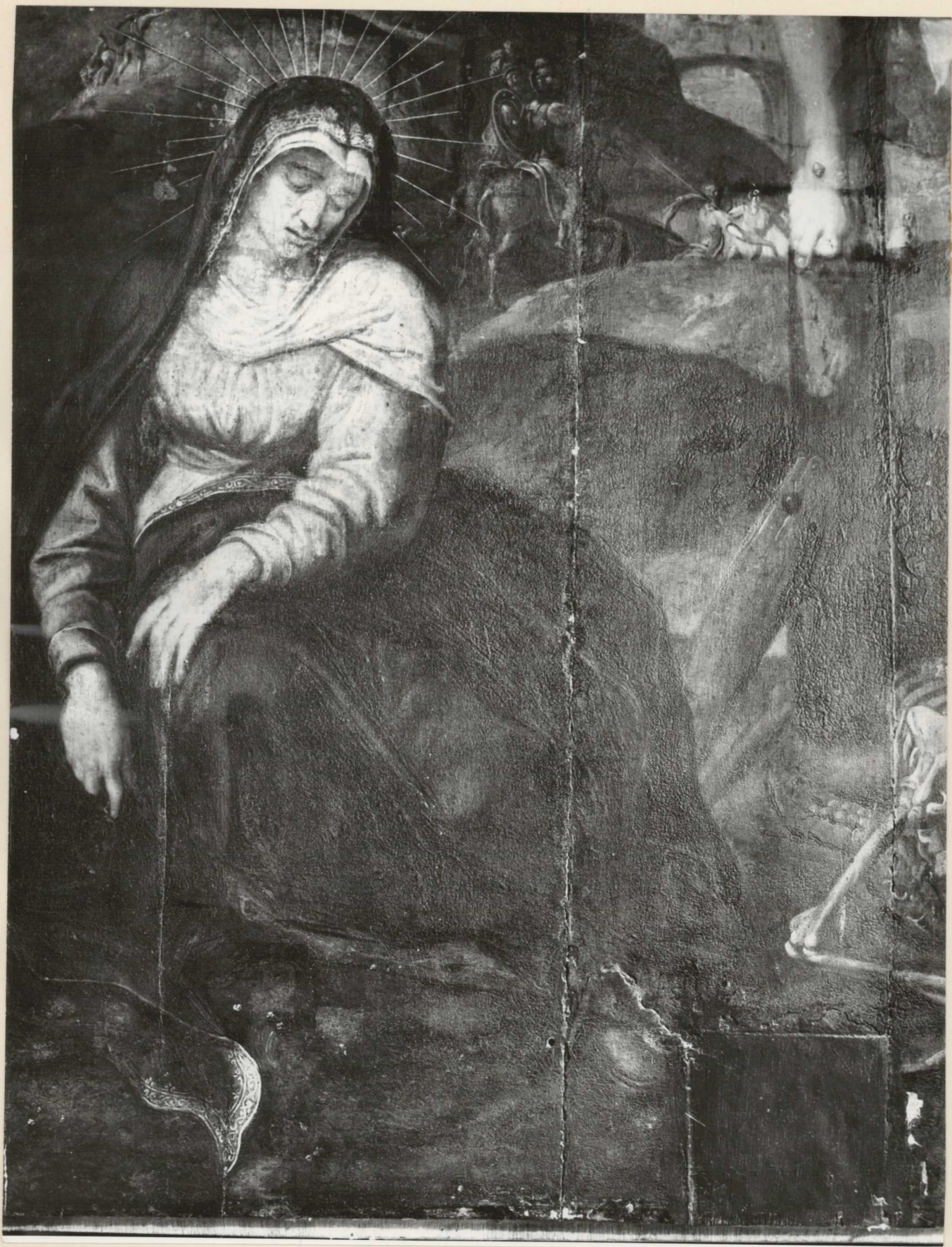
18. Részlet. Tisztítás közben.