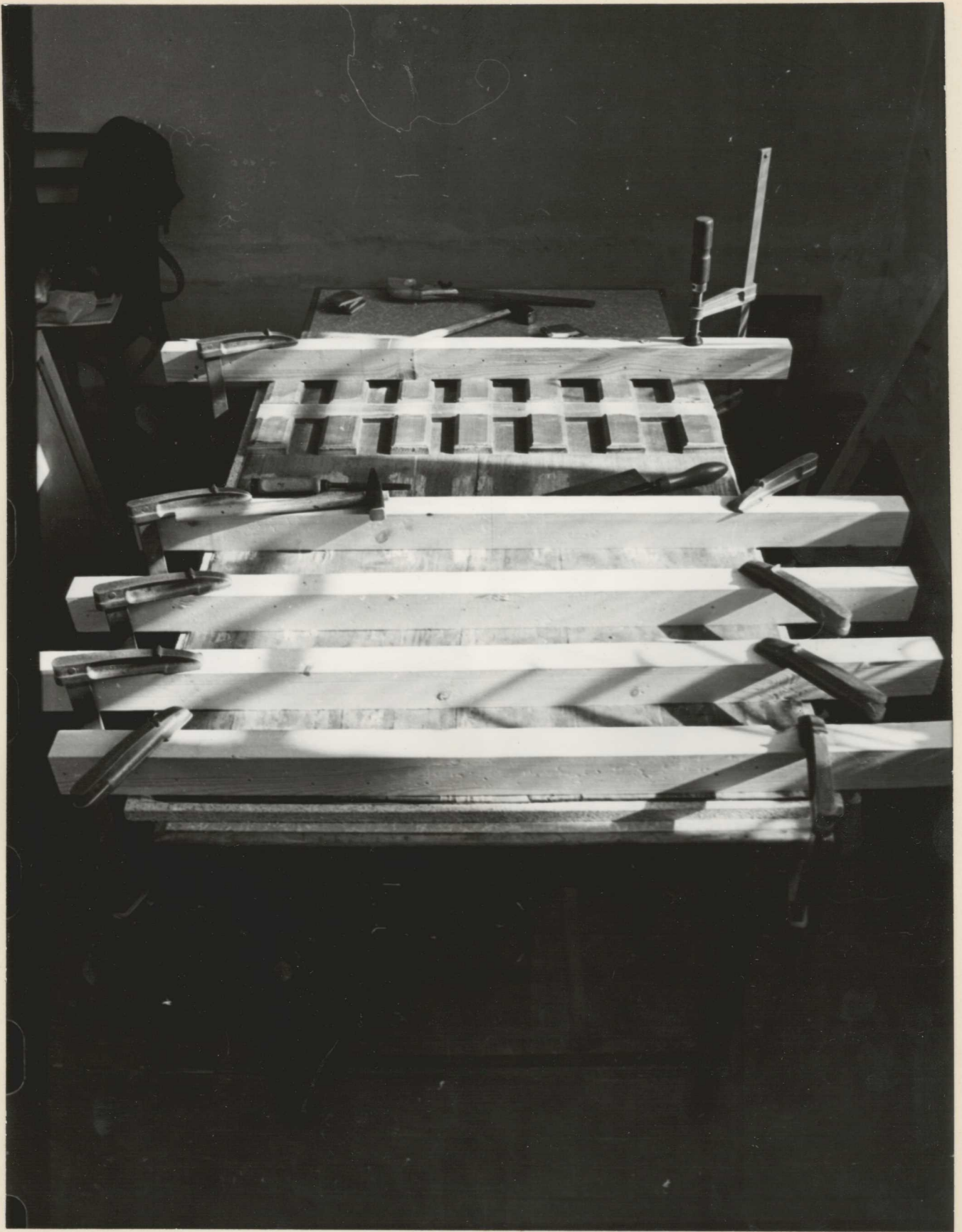
12. A régebbi parkettázás eltávolítása és a tábla kiegyenesítése folyamatos préseléssel.