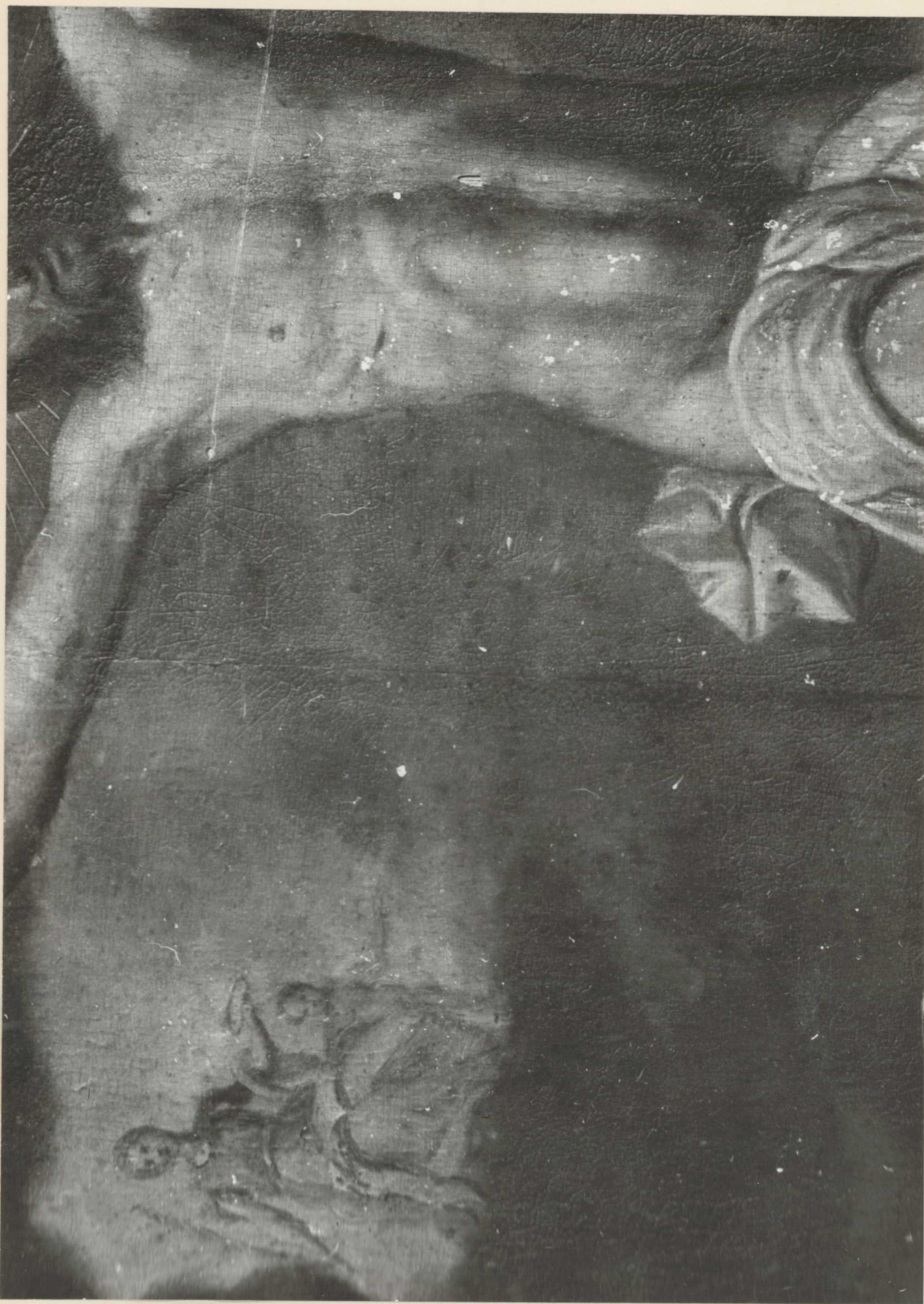
5. részlet. Összefüggő egyenletes vastag lakkréteg vorítja a felületet. A helyenként látható apró, fehér foltok a lepattozott lakkréteg alatt levő eredeti festékréteg.