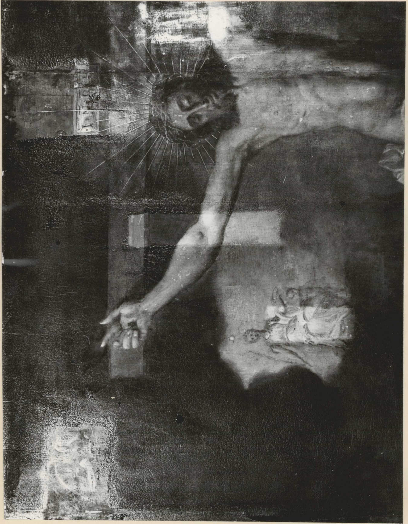
15. Tisztítópróbák. Részlet.