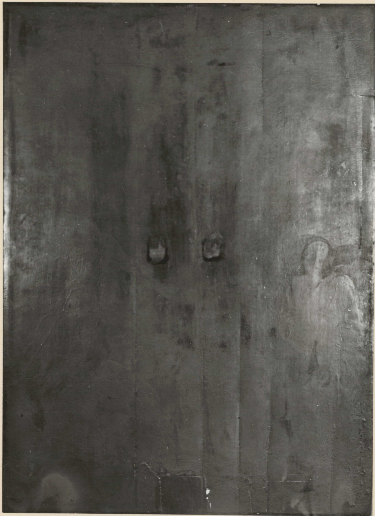
4. Restaurálás előtti állapot. Ultraibolya felvétel. Megfigyelhető a tábla vetemedése és repedése.