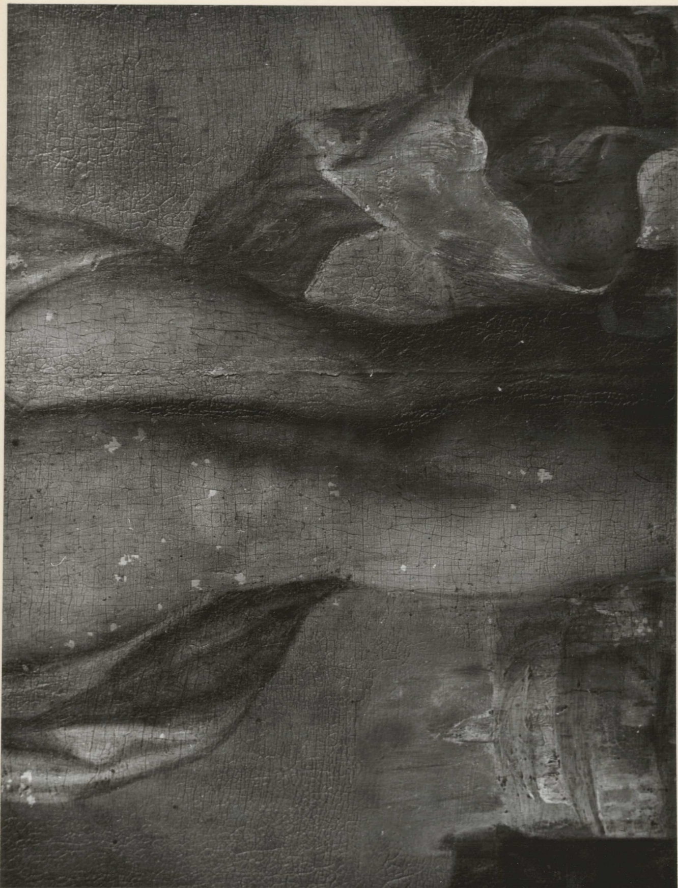
8. részlet. megfigyelhető a drapéria átfestése, a lakréteg helyenkénti lepattozása.