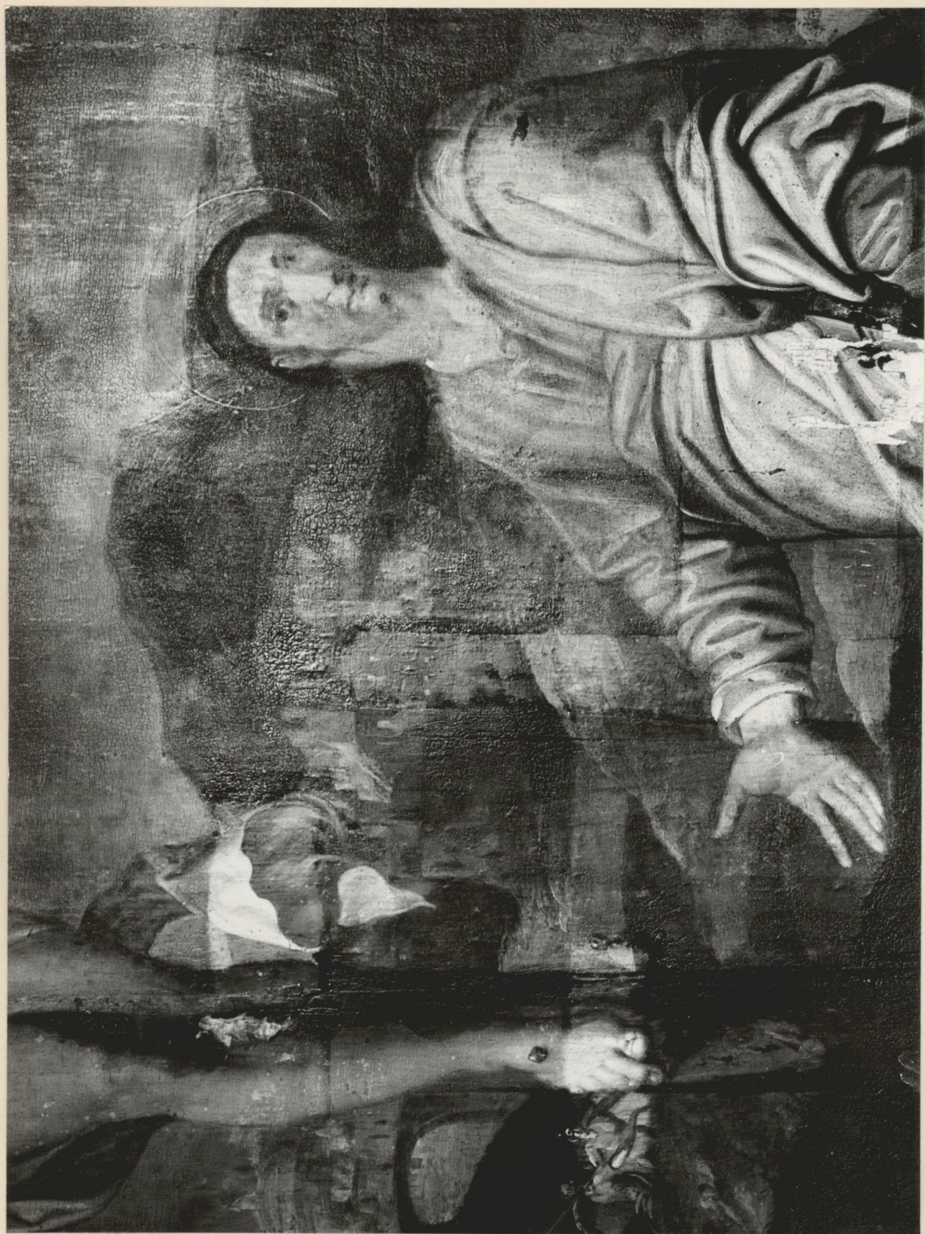
20. Készlet. Tisztítás közben.