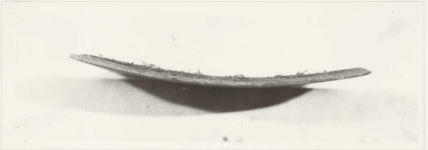
Átvételi állapot - a meggörbült fatábla alsó éle.