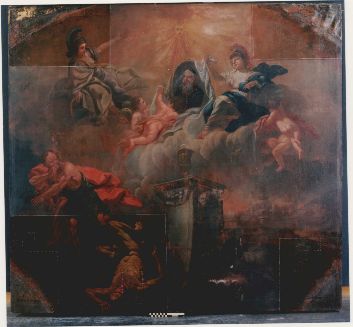
A SARKOK TISZTÍTÁSA UTÁN