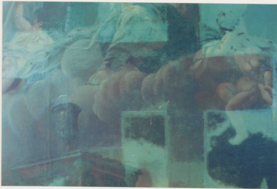
TISZÍTÁS KÖZBENI LUMINESZCENSZ FELVÉTEL