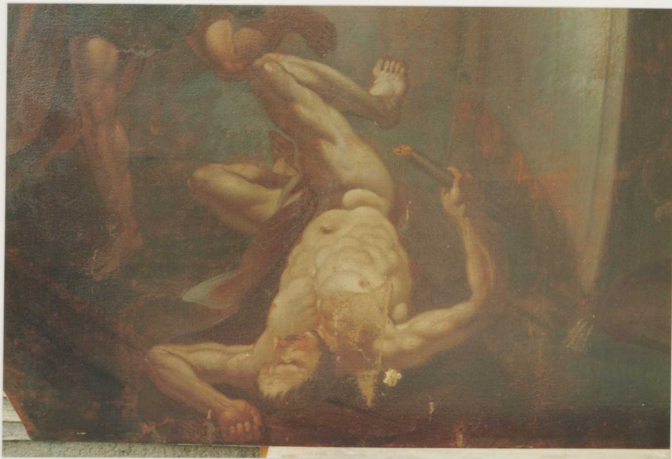
ΠΙΣΤΙΤΑΣ, ΕΣ ΦΕΛΟΥΕΤΙ ΚΙΕΓΕΣΥΤΕΣ ΟΥΑΝ