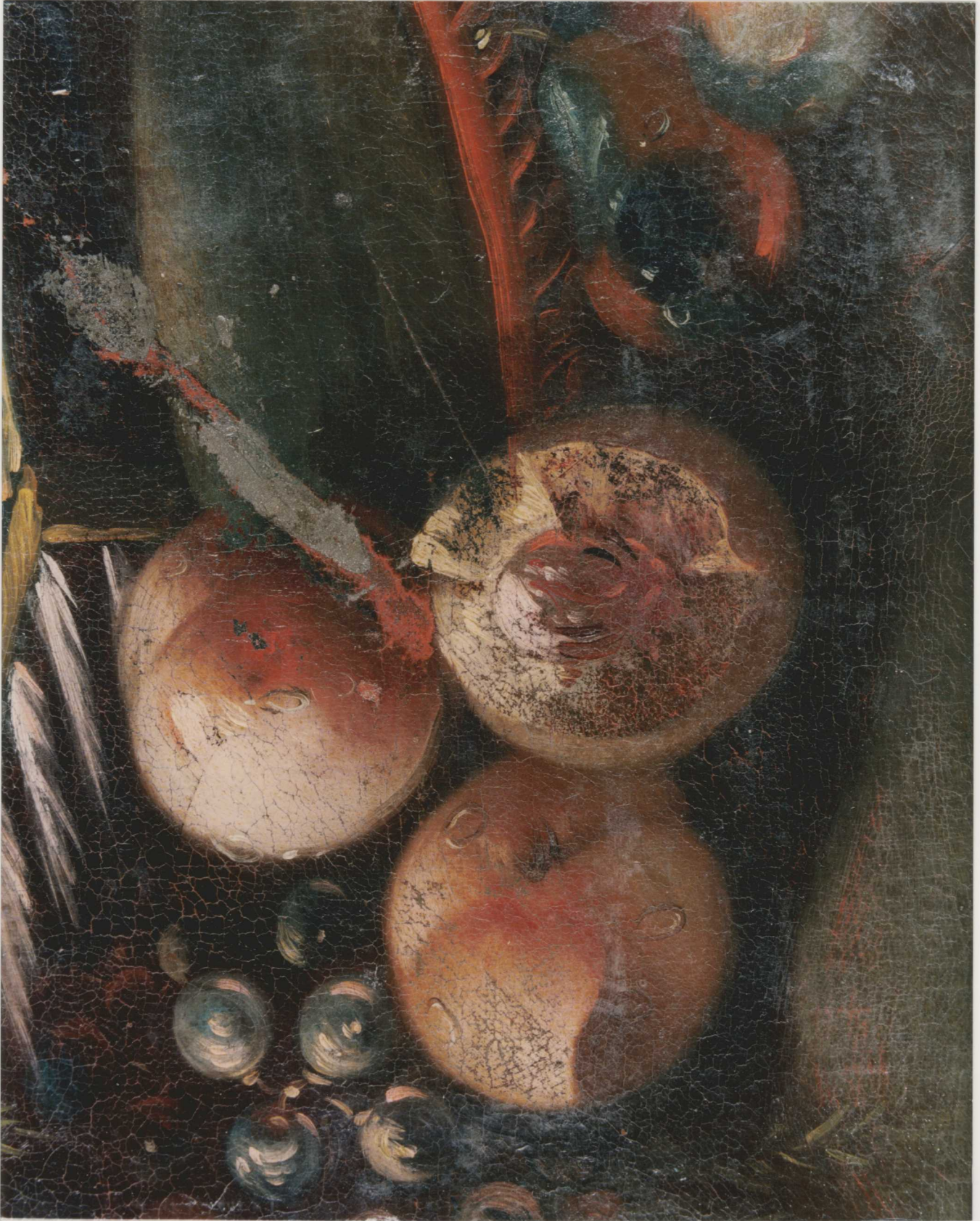
TISZTÍTÁS UTÁNI RÉSZELET