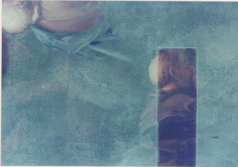
UMINESZCENSZ FELVÉTELEK A TISZTÍTÓPRÓBÁKRÓL