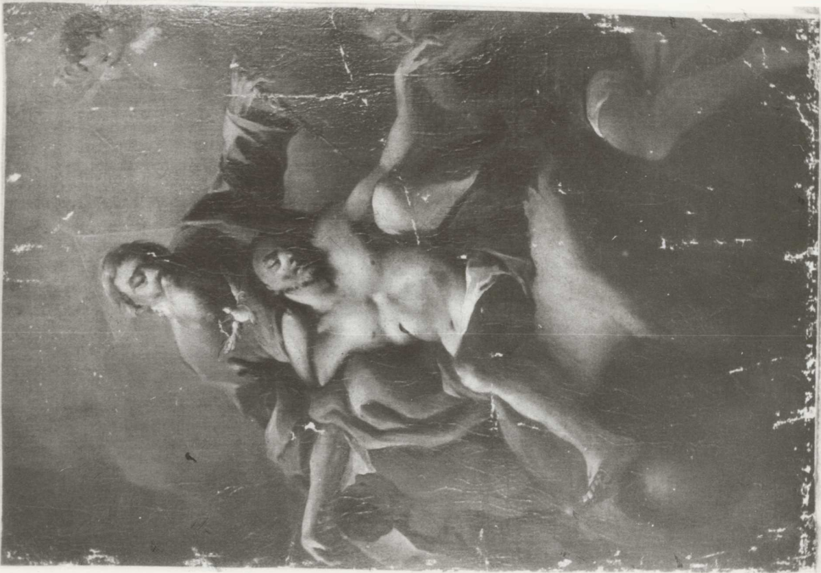
Tisztítás és tömítés után.