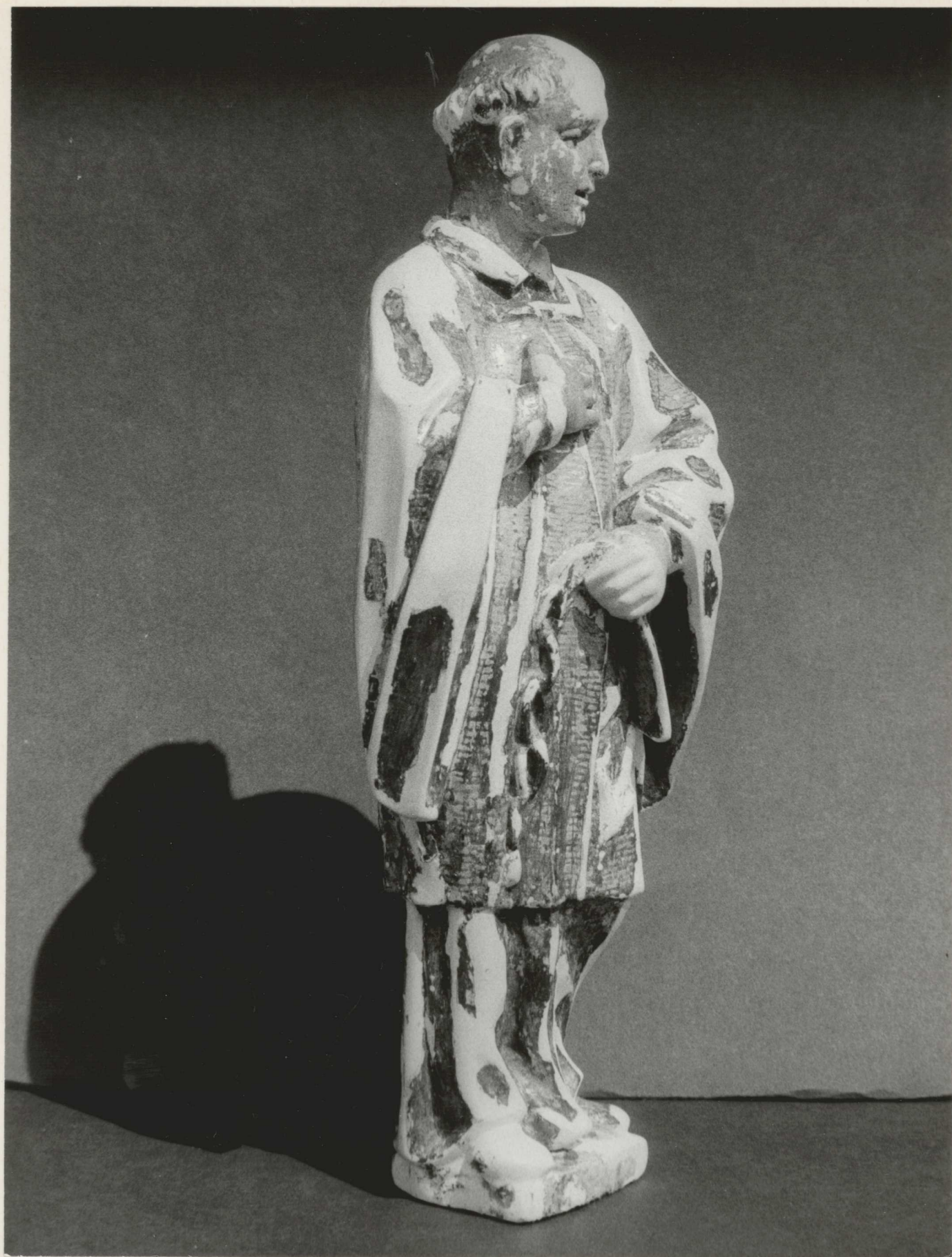
6. AZ alapozás hiányainak kiegészítése.