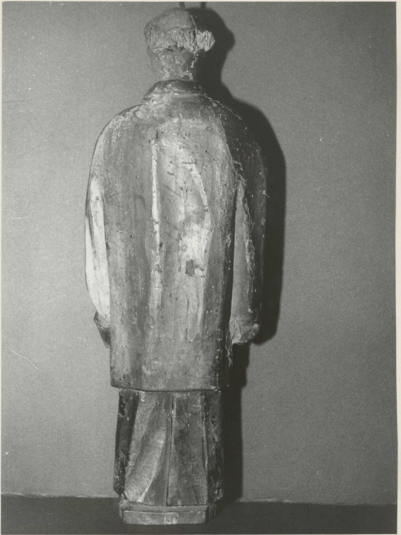
3. Afarontó rovarok kirepülő nyílásai a hátoldalon .