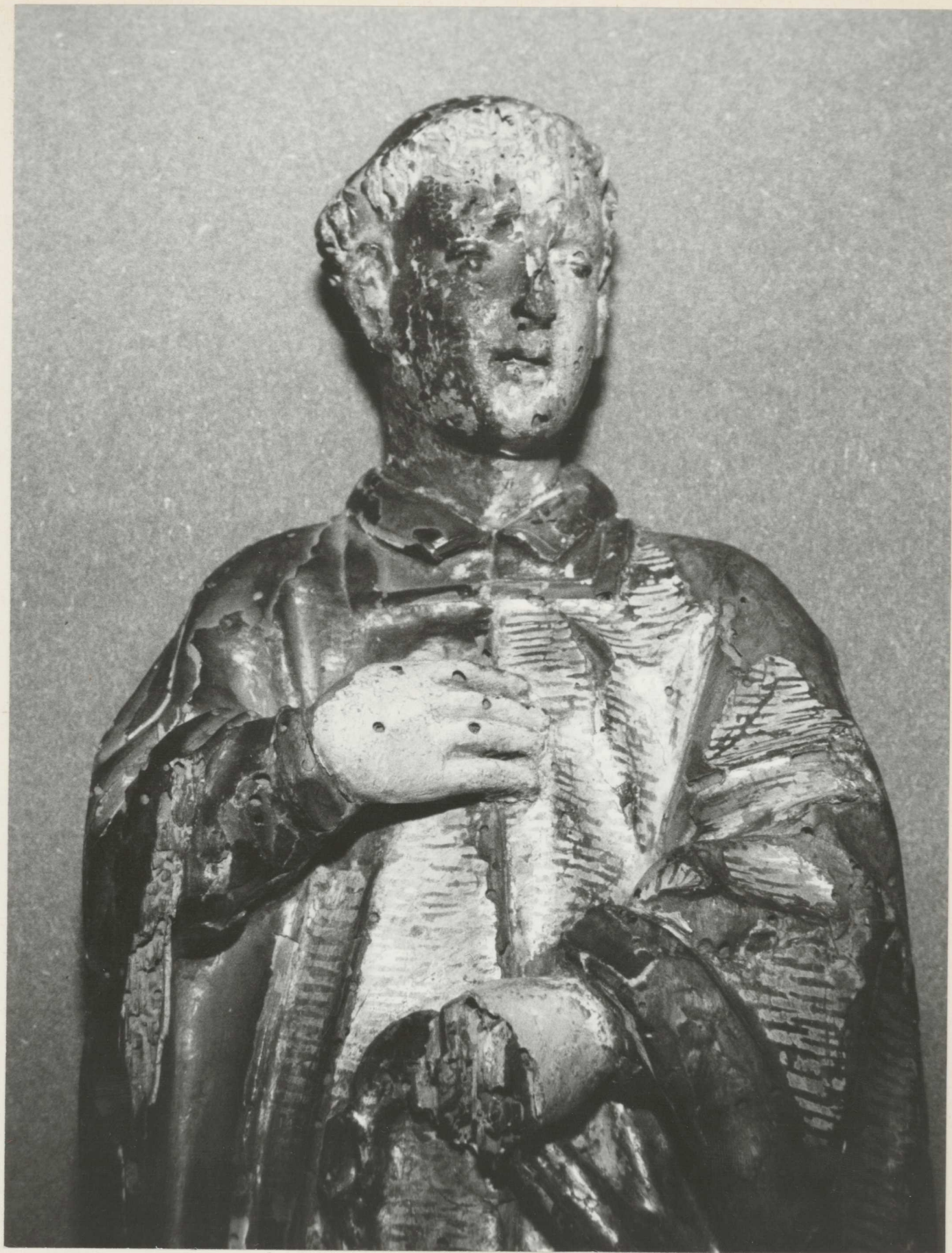
2. A szobor faanyagát a farontórovarok által károsodás érte. Számos helyen kirepülőnyílások és apróbb kitérődések láthatók.