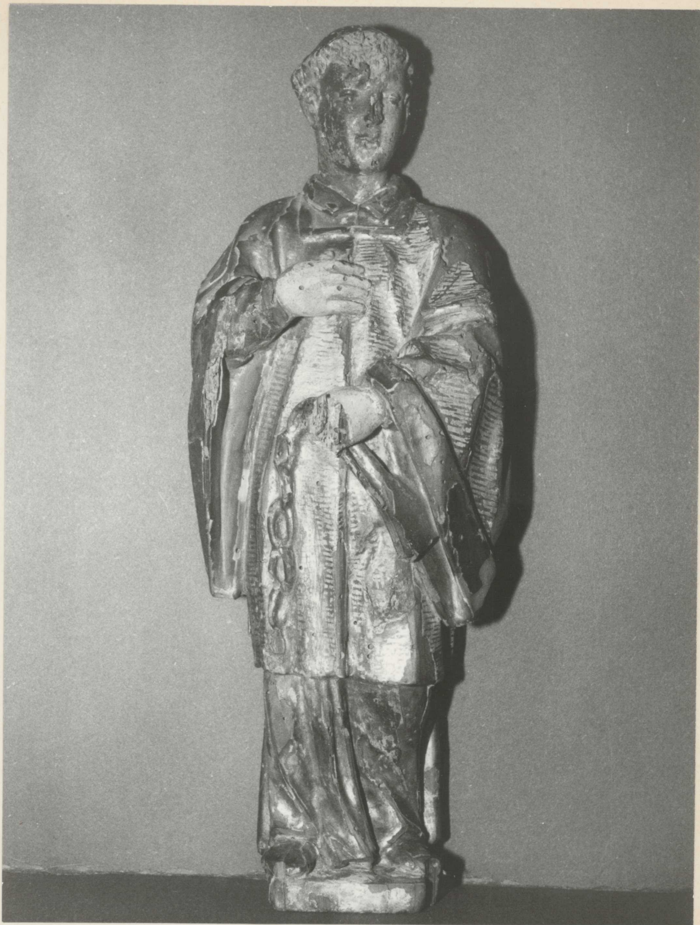
I. Szt. Kelemen szobor restaurálás előtti állapota. Az alapozás több helyen kipattogzott, hiányos.