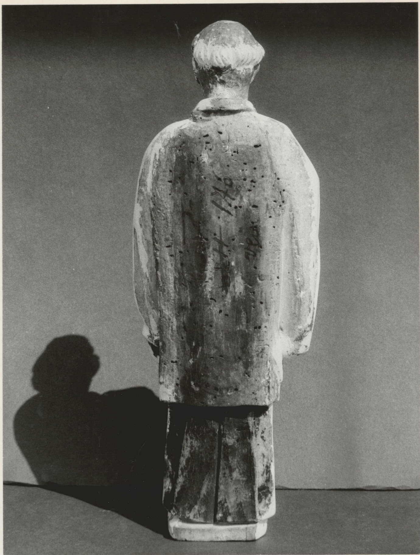
7. A haj kiegészítése és az alapozás potlása a hátoldalon .