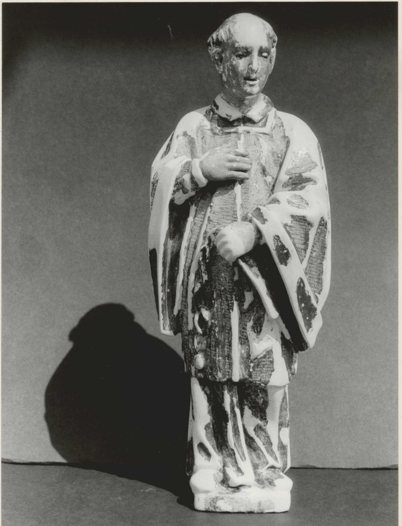
5. Az alapozás hiányainak kiegészítése, a horgony pótlása.